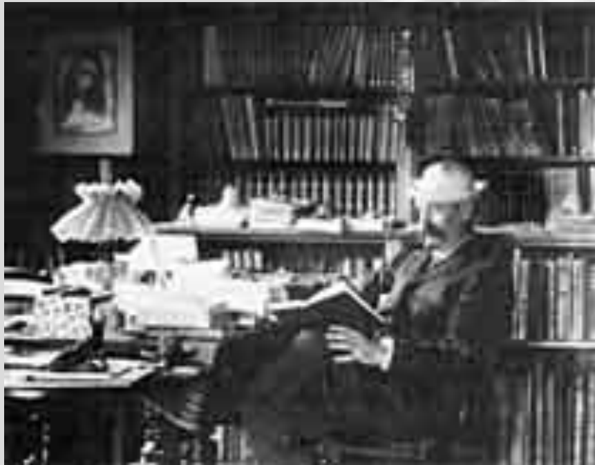
Dans son bureau...